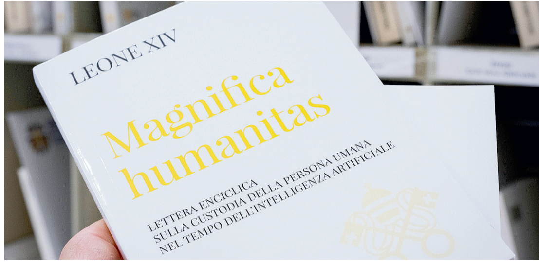
L'enciclica "Magnifica humanitas" di Leone XIV è stata presentata il 25 maggio in Vaticano dallo stesso Papa

Oppure? Oppure no, non è questo l'uomo della storia. Sullo sfondo d'una vocazione così alta si proietta il volto oscuro d'un male fatto di crudeltà, di ferocia, di menzogna, di guerra e genocidio, di schiavitù, di oppressione dei poveri, di arsenali di ordigni nucleari capaci di annientare la terra, di violenze che sfigurano l'immagine stessa dell' humanitas . Nei gomiti della storia, a ogni volger vichiano di tempi nuovi e di rerum novarum , si riproduce drammaticamente quella che abbiamo imparato a chiamare «la questione sociale». Così la domanda, semplice e terribile, che traversa i secoli e ancora ci sale dal cuore come supplica orante di verità e di speranza, è di nuovo il perché medesimo dell'uomo come enigma del cosmo. Pascal nel dirlo «fragile canna pensante» lo fece più grande della montagna che lo uccide «perché l'uomo sa di morire». Heidegger, nel secolo breve e insanguinato dell'ecatombe nucleare, ha chiamato l'uomo «pastore dell'essere» per descrivere il compito che non può essere tradito. Non padrone, ma custode dell'essere, essendo folle insipienza una civiltà che riduce tutto a oggetto da usare, calcolare e sfruttare. Eppure ancora una speranza tiene accesa la sua fiammella. Nel cuore di una città appesantita e disperata, simbolo e sintomo d'una condizione umana d'incomprensibile sventura, Albert Camus ha potuto scrivere che «ci sono nell'uomo più cose da ammirare che da disprezzare».