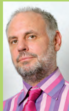
Philip Nitschke che tenta di emulare Jack Kevorkian ma con una mentalità molto più imprenditoriale. Sotto: il simbolo di Exit l'associazione da lui creata

Secondo l' Observer Nitschke, autore di questo «Peaceful Pill Handbook» («Il manuale della pillola della pace», ndr) ritiene che il Regno Unito sia proprio il Paese «ideale» per testare il kit necessario a valutare l'efficacia di certe sostanze e a calibrarne il dosaggio. Exit international, il movimento fondato dal medico, raccomanda però di acquistare i farmaci in Messico, così da sfuggire a ogni noia legale. Il principale si chiama Nembutal ed è un potente barbiturico usato di solito dai veterinari. Messo sul commercio al prezzo di 35 sterline, il kit contiene sostanze chimiche che cambiano colore quando vengono mischiate a barbiturici. L'effetto letale è assicurato. Come le polemiche, del resto. E la pubblicità per il suo controverso ideatore.