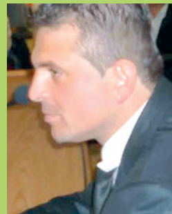
Piero Uroda presidente dei Farmacisti cattolici