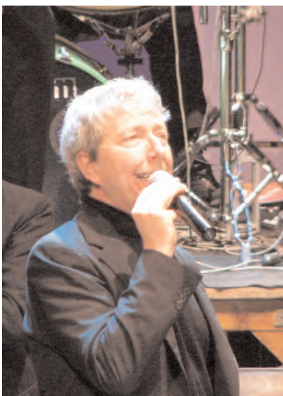
Fabio Concato ospite d'onore a Pavia. In alto: il numero acrobatico dei ragazzi di Nomadelfia

grande da una straordinaria performance di Fabio Concato, che ha presentato al pubblico alcuni dei suoi brani più intensi, tra cui la storica Una domenica bestiale .