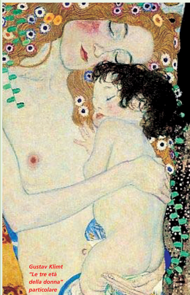
Gustav Klimt "Le tre età della donna" particolare

Esprimiamo viva gratitudine ai membri del Comitato Scientifico e organizzativo della 45° Settimana sociale per la redazione del documento preparatorio pubblicato dal Centro editoriale dehoniano di Bologna, nel quale pienamente ci riconosciamo. La lettura di tale documento, al termine del quale sono formulate domande per favorire l'approfondimento, ci ha suggerito di intervenire con questo scritto. Esso è stato elaborato in un apposito seminario svoltosi a Dobbiaco dal 26 agosto al 2 settembre 2007 ed è stato approvato dal Consiglio direttivo del Movimento per la vita il successivo 29 settembre.